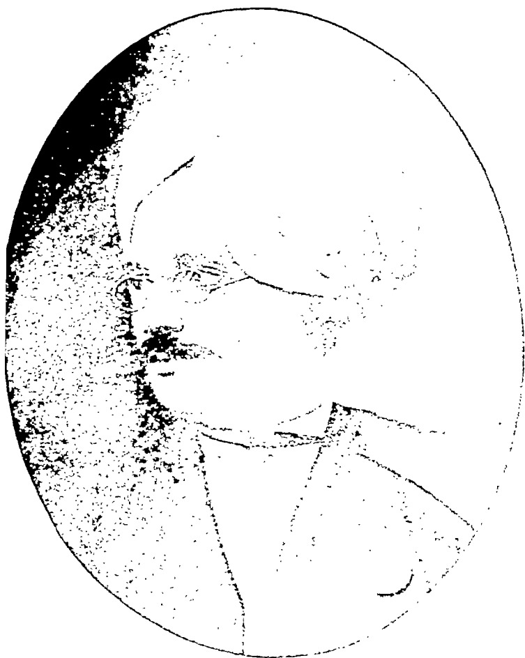
गोम्बामी तीर्थराम एम० ए०